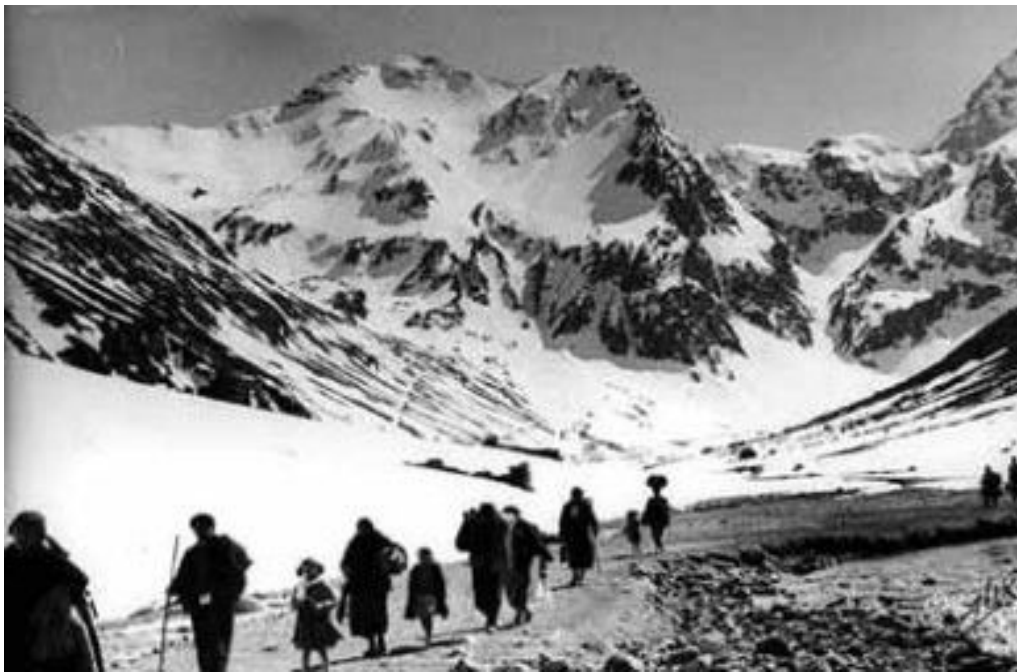
Población civil tras cruzar a pie los Pirineos durante la Bolsa de Bielsa. Abril de 1938.