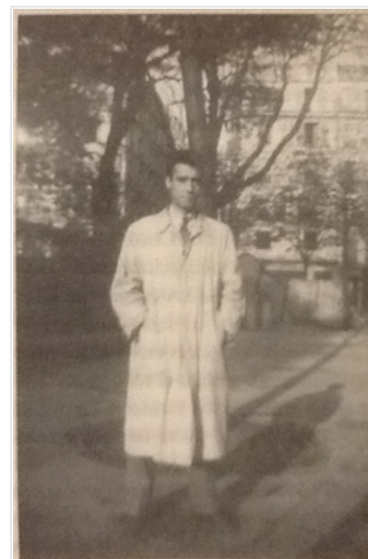
De "Enterrar a los muertos" p.105